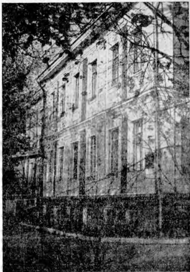
Рис. 1. Загорский детский дом для слепоглухонемых

опыта, поэтому обратились к опыту прошлого. Особую нужду мы испытывали в сведениях о случаях трудовой и социальной реабилитации totally слепоглухонемых с младенчества. Поэтому биографии таких слепоглухонемых, достигших наиболее выдающихся успехов и представляющих разные школы, мы приводим подробно.